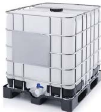
Cuve aérienne double paroi