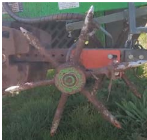
Pal injecteur utilisé dans l'autres régions