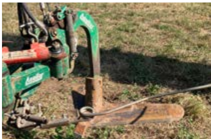
Outils à lames bineuses intercep.