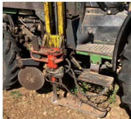
Attelage entre les roues du tracteur