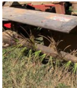
Brosse à axe horizontal