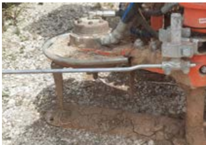
Outils rotatif animé + lame