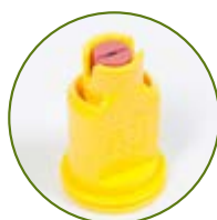
Albuz CVI OC 80°