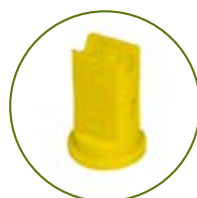
Lechler IDKS 80° (jet oblique)