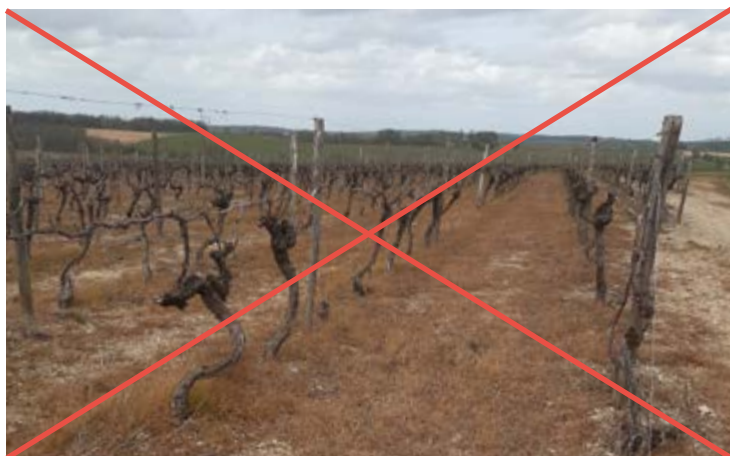
Désherbage chimique totale d'une parcelle

« Le désherbage chimique total des parcelles est interdit. Sur tous les inter-rangs, la maîtrise de la végétation, semée ou spontanée, est assurée par des moyens mécaniques ou physiques. Le désherbage chimique des tournières est interdit. »