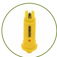
Teejet AI 80° ou AIUB