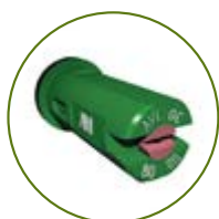
Albuz AVI 80° ou AVI OC

Exemple de buses anti-dérive à jet plat excentré :