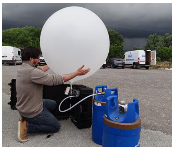
Le ballon peut être gonflé et déclenché à distance via un automate, ou sur place par le viticulteur quelques minutes avant l'arrivée du nuage d'orage.