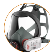
Exemple d'un masque panoramique (norme EN 166)