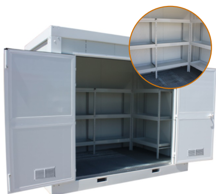
Container local phyto

D'autres systèmes de stockage sous forme d'armoire et de container sont également disponibles à l'achat mais uniquement autorisés si la manipulation des produits est réalisée par l'exploitant lui-même :