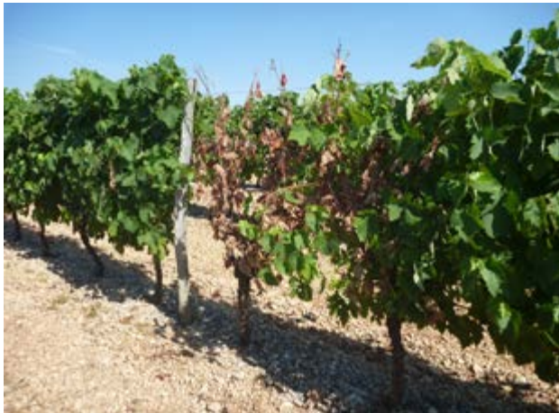
Forme apoplectique de l'Esca-BDA

On distingue parfois des formes lentes et rapides (apoplexie). Toutefois des suivis réalisés chaque semaine sur tous les pieds d'une parcelle fortement touchée ont montré que les dessèchements de ceps complets se produisaient le plus souvent assez lentement, sur plusieurs semaines, donc ne correspondent pas à une forme « foudroyante » malgré l'aspect final des ceps complètement desséchés. Certains ceps complètement desséchés émettent tardivement de jeunes pousses sans aucun symptôme, mais leur avenir les années suivantes est compromis.