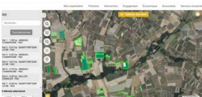
Exemple de représentation cartographique sur PC