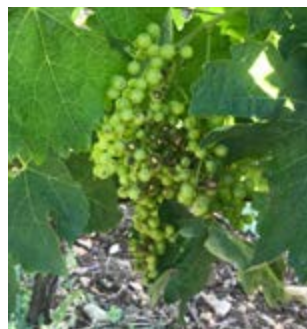
Brûlures de soufre