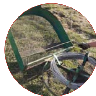
Enrouleur manuel fils releveurs